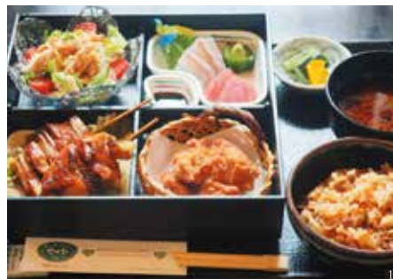
① 地元産の若鶏をふんだんに使用。錦爽鶏御膳 2,200円