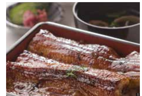
① うな重 時価(お問い合わせください)