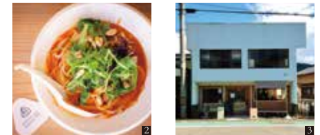
② オリジナル米めん(フォー) 1,000円 ③ 2階はドミトリータイプの宿泊所。素泊まり 4,200円~