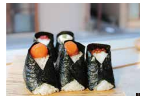
① 自家栽培米を使った各種おむすび 210円~