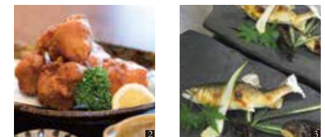
② 東栄町の錦爽鶏の唐揚げ定食 ③ 鮎料理。夏季限定、要予約で提供します