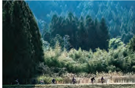
さわやかな空気と眩しい緑があふれる自然の中を、仲間とのんびりと自転車で駆け抜ける。