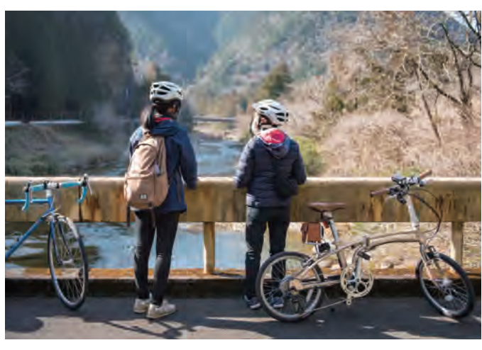
電動アシスト自転車なら、体力に自信がない人でも坂道も楽々登れて、山のまち巡りが気軽に楽しめます。仲良し女子グループで参加し、自然を満喫してはいかがでしょうか。

デザイン性も機能もすごい！ 電動アシスト自転車 イマドキ事情 観光まちづくり協会では、最新の電動アシスト自転車を導入。頼れるアシストと滑らかな乗り心地が特徴で、また一回の充電で50kmの走行が可能とあって安心して山の自転車さんぽが楽しめます。バッテリーをブラウンレザーのケースに収納するなどデザインにもこだわったDaytona製のミニベロなどが揃っています。