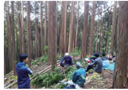
↑山林が面積の93%を占める東栄町。森林組合が間伐などをして山を管理している。

かつて林業で盛えたまちには、山間のまち東栄町は古くから林業が盛んで、17世紀末(江戸時代の元禄)にはすでにシギ(ヘビ)の植林を行い、製材して食糧と交換していたとの記録も残っています。明治以降は優良な三河杉の産地として、林業は1900年に渡りまちの繁栄を支えてきました。また養蚕や馬(重馬)の産地としても時代の需要に応えてきました。