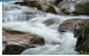
↑ポットホールが見られる「煮え淵」