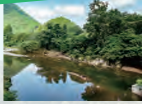
↑「大千瀨でらす」の川スポット