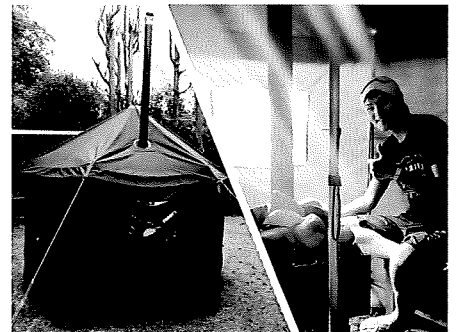
薪ストーブを活用したテントサウナ体験 ▲

地域通貨券「オニ券」の使用方法 ※都合により体験メニューを変更する場合があります。 ※一部、別途料金となる体験があります。