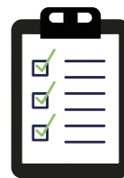
体調チェック表の記入